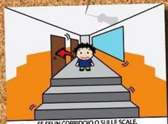
SE SEI IN CORRIDOIO O SULLE SCALE, ENTRA IN UN'AULA