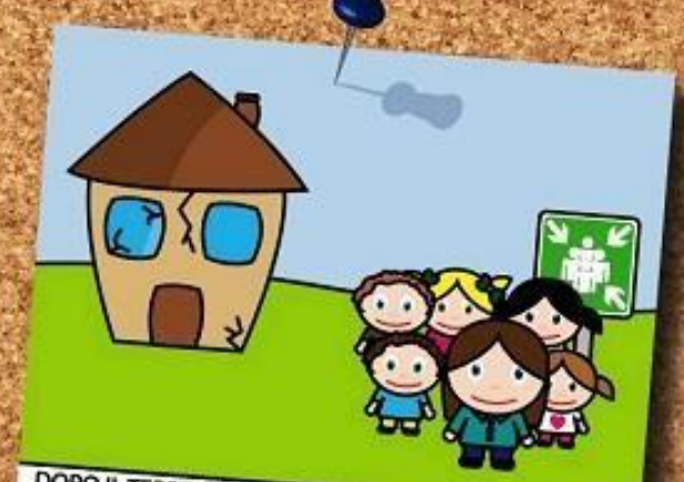
DOPO IL TERREMOTO, ESCI DALL'EDIFICIO SENZA USARE L'ASCENSORE E RAGGIUNGI IL PUNTO DI RACCOLTA