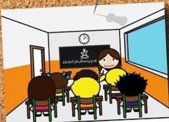
SE DURANTE LA LEZIONE SI VERIFICA UN TERREMOTO