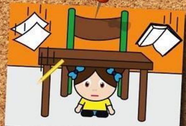
RIPARATI SOTTO AL BANCO