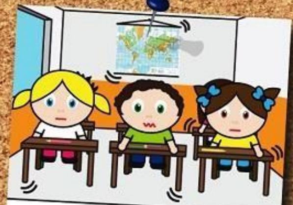
MANTIENI LA CALMA