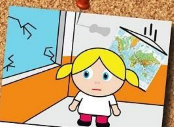
ALLONTANATI DALLE FINESTRE E DAGLI OGGETTI APPESI